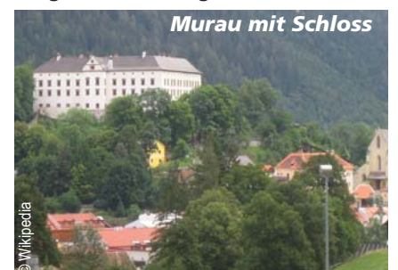
Murau mit Schloss

Hoch auf dem Murauer Schlossberg steht die sehenswerte Schlossanlage, deren Wurzeln bis auf das Jahr 1232 zurückreichen. 1623 ließ Graf Georg Ludwig die alte Burg abtragen und das vierkantige Renaissanceschloss erbauen. Das Schloss Murau steht bis heute im Besitz des Hauses Schwarzenberg und ist im Rahmen von Führungen zu besichtigen.