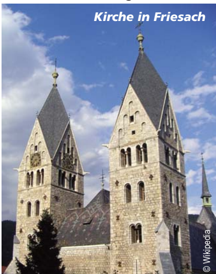
Kirche in Friesach

Jüdische Händler gründeten die Stadt im Jahr 1074 als wichtigen Handelsposten im transalpinen Handel der Region. Judenburg besitzt damit auch das älteste Stapelrecht Österreichs, eine Art „Wegezoll“. Aus dieser Zeit als „Hauptstadt“ der Obersteiermark stammt auch die sehenswerte, weil sehr gut erhaltene